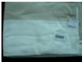
CTL-Nr. 18 Babytragetuch Tunis, L-tun