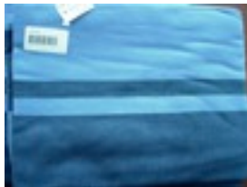
CTL-Nr. 15 Babytragetuch Salzburg, L-sal