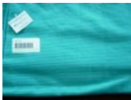
CTL-Nr. 42 Babytragetuch Acapulco, L-aca