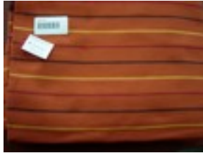
CTL-Nr. 30 Babytragetuch Santiago, L-san