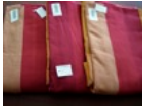
CTL-Nr. 19 Babytragetuch leichtes Delhi, L-s-del