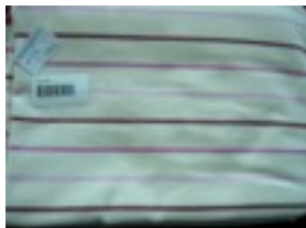
CTL-Nr. 13 Babytragetuch Lille, L-lil