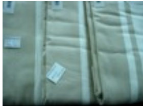
CTL-Nr. 6 Babytragetuch KbA-Kairo, L-B-kai