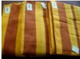
CTL-Nr. 9 Babytragetuch KbA-Nairobi, L-B-nai Karton aus 08