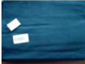
CTL-Nr. 38 Babytragetuch Helsinki, L-hel