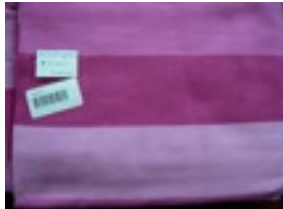
CTL-Nr. 35 Babytragetuch Miami, L-mia