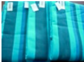
CTL-Nr. 5 Babytragetuch KbA-Dublin, L-B-del