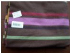
CTL-Nr. 28 Babytragetuch Wien, L-wie